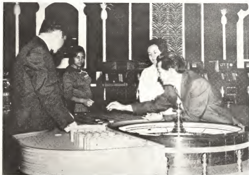
Esaki ta e Casino di mas grandi den e area aki.

Patras den fondo nos por ripara e cantidad di Jack-potnan cu tin ey den.